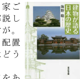
建物が語る日本の歴史

寺院建築は法隆寺が現存しているし、東大寺も建て替えられて続いている。そこに焦点をあてて述べているのが、新着ではないけれど「建物が語る～」です。こちらもどうぞ。