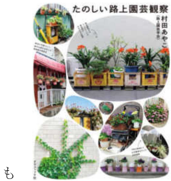
東京「多叉路」散歩 萩窪圭 淡交社 たのしい路上園芸観察 村田あやこ グラフィック社

多叉路で挙げられているのは三叉路から九叉路。九? 今は七叉路に見えるけど、古地図をみると十叉路。野火止用水の先で鎌倉街道が江戸道、秩父道などと交わるあたり。