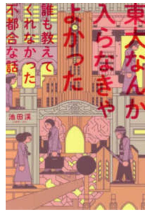
東大出てバカはバカ 豊田有恒 飛鳥新社 東大なんか入らなきゃよかった 池田 飛鳥新社

共に著者は東大。東大理Ⅱ・慶大医と博士課程中退。勘違い上から目線を全篇実名で。豊田真由子氏とか。「選ばれた」と錯覚させる受験勉強からの脱却を説き、最強の学歴があっても生きづらいことを細かく綴る。キャリア官僚の月 200 時間超の残業地獄、地方公務員になった東大卒が受けた壮絶いじめなど。よ〜く考えよう。