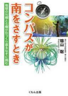
コンパスが南をさすとき 陰山 龍 くもん出版

共に著者は東大。東大理Ⅱ・慶大医と博士課程中退。勘違い上から目線を全篇実名で。豊田真由子氏とか。「選ばれた」と錯覚させる受験勉強からの脱却を説き、最強の学歴があっても生きづらいことを細かく綴る。キャリア官僚の月 200 時間超の残業地獄、地方公務員になった東大卒が受けた壮絶いじめなど。よ〜く考えよう。