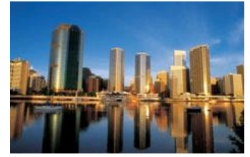
ブリスベン (イメージ)

クィーンズランド州の州都ブリスベンは、人口250万人を有するオーストラリア第3の都市。街の中心部にはブリスベン川が流れ、緑豊かな公園とモダンな高層ビル、伝統的な建築物が見事な調和をみせています。シティ中心部のオープンカフェはいつも多くの人々で賑わい、少し歩けば緑豊かな公園やブリスベン川の流れを感じられるリバーサイドが迎えてくれます。