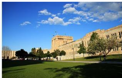
クイーンズランド大学(イメージ)